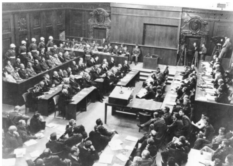
Bundesarchiv, Bild 183-H27798 Foto: s.Ang. | 30. September 1946

El contexto francés sobre historia, memoria y libertad es bien distinto, incluso contrario, al contexto español. Diferencias profundas que no tienen en cuenta los colegas que están intentando trasladar a España lo que está diciendo Pierre Nora enfrentando historia (académica) con memoria (política), desde una postura tradicional que ya exhibía en 1974 propugnando contracorriente (hoy es diferente, Annales no existe) en Faire l'histoire el retorno positivista del acontecimiento.