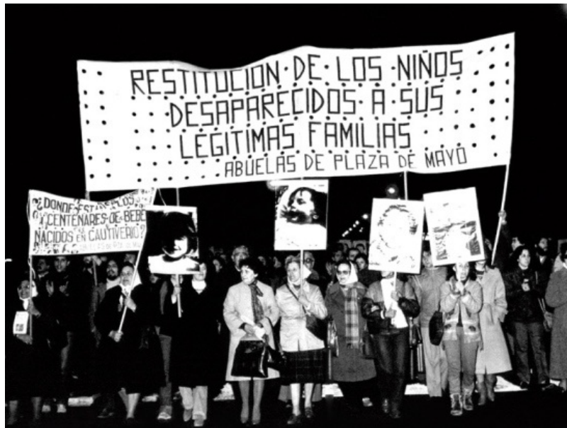
Abuelas de Mayo, Argentina en el web http://www.abuelas.org.ar/